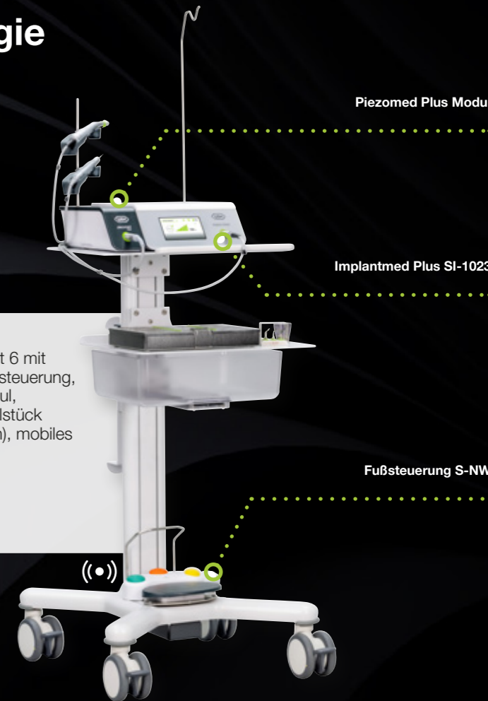
Piezomed Plus Modul